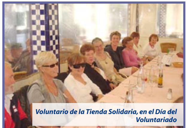
Voluntario de la Tienda Solidaria, en el Día del Voluntariado