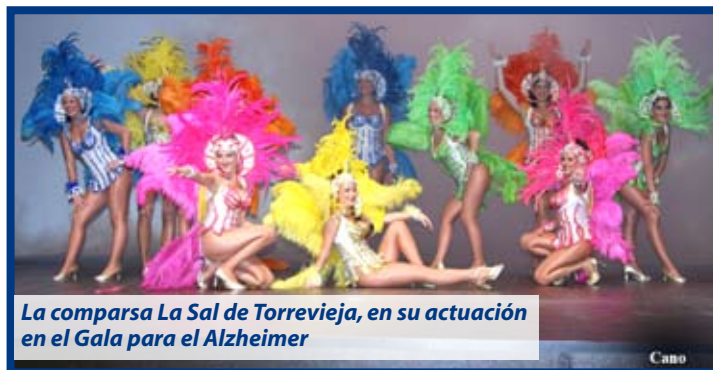
La comparsa La Sal de Torrevieja, en su actuación en el Gala para el Alzheimer