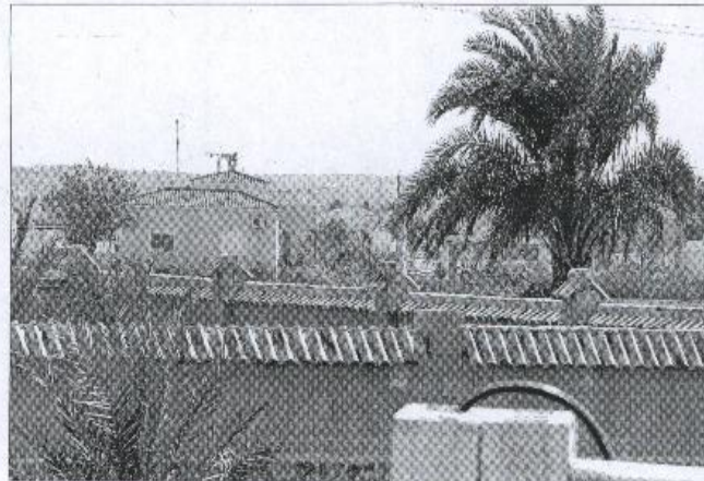
Construcciones ilegales en Catral que ocupan el parque natural del Hondo.

niega que su equipo votara a favor de estos expedientes, aun cuando faltaban documentos, como la licencia previa que la Conselleria de Territorio y Vivienda debía conceder a los promotores, antes de solicitar cualquier construcción en terreno no urbanizable.