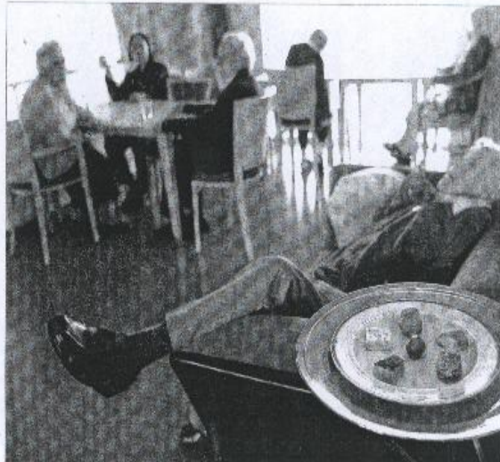
En la Comunitat el número de afectados de algún tipo de demencia alcanza los 200.000.